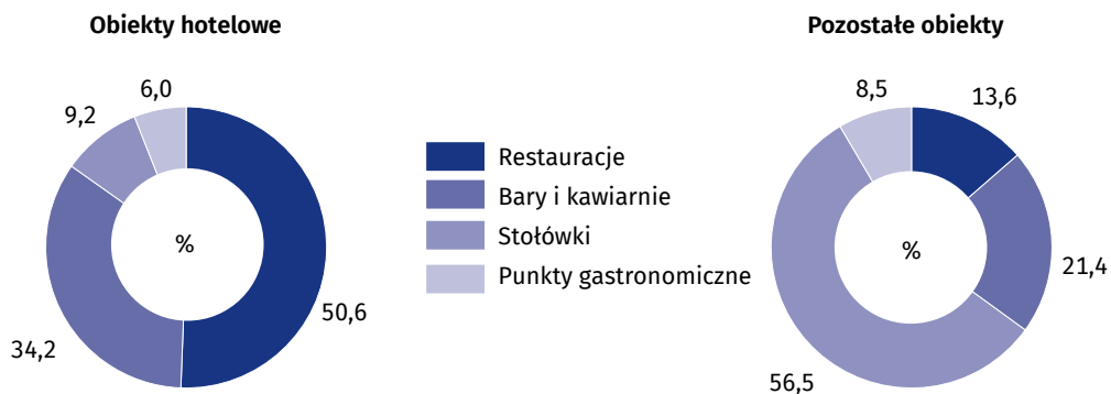
Wykres 4. Placówki gastronomiczne w turystycznych obiektach noclegowych w 2020 r. Stan w dniu 31 lipca

Prezentowane informacje opracowano na podstawie wyników badania turystycznej bazy noclegowej, prowadzonego w cyklu miesięcznym z wykorzystaniem formularzy KT-1. Badanie to dostarcza informacji o stanie i wykorzystaniu turystycznych obiektów noclegowych posiadających 10 lub więcej miejsc noclegowych. Dane prezentowane są z uwzględnieniem imputacji dla jednostek, które odmówiły udziału w badaniu.