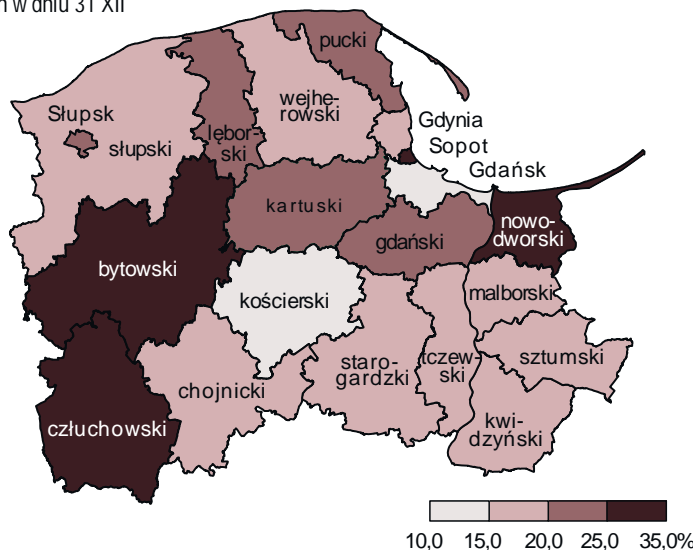
Ćwiczący w klubach sportowych na 1000 ludności według powiatów w 2012 r. Stan w dniu 31 XII

Kobiety najczęściej uprawiały piłkę siatkową (4,2% ćwiczących w sekcjach sportowych), lekkoatletykę (3,5%), koszykówkę (2,5%) i piłkę ręczną (2,4%). Juniorzy i juniorki stanowiący 72,3% ćwiczących w sekcjach sportowych, uprawiali głównie piłkę nożną (31,1% ogólnej liczby ćwiczących juniorów i junierek), piłkę siatkową (10,0%), lekkoatletykę (8,1%) i koszykówkę (7,2%).