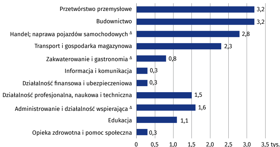
Wykres 4. Zlikwidowane miejsca pracy według wybranych sekcji