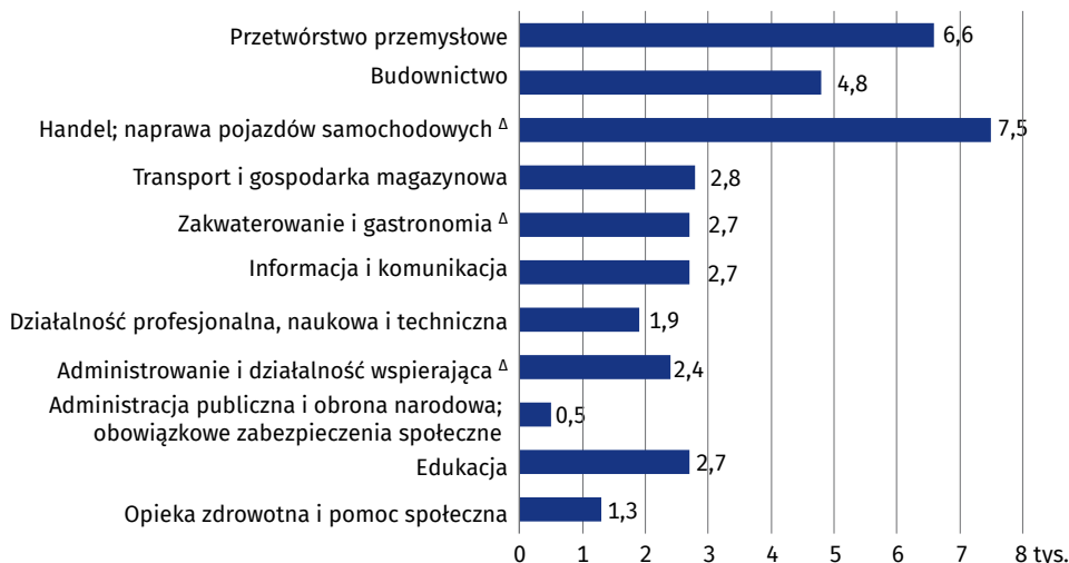
Wykres 2. Nowo utworzone miejsca pracy według wybranych sekcji

W końcu IV kwartału 2019 r. odnotowano 2,0 tys. nowo utworzonych wolnych miejsc pracy (o 0,5% więcej niż w analogicznym okresie 2018 r.), głównie w jednostkach małych (74,5%). Największą liczbą nowo utworzonych wolnych miejsc pracy dysponowały jednostki prowadzące działalność w handlu; naprawie pojazdów samochodowych (67,0%), w transporcie i gospodarce magazynowej (10,8%) oraz w informacji i komunikacji (8,6%). Najwięcej miejsc pracy przeznaczonych było dla pracowników biurowych (65,5%), specjalistów (12,2%) oraz operatorów i monterów maszyn i urządzeń (11,1%).