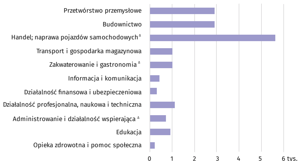
Wykres 4. Zlikwidowane miejsca pracy według wybranych sekcji w 2018 r.