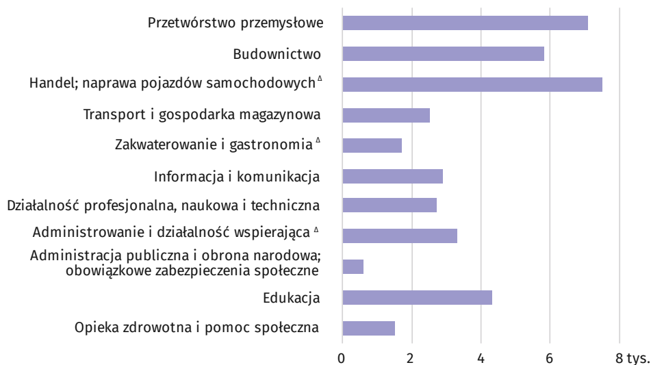
Wykres 2. Nowo utworzone miejsca pracy według wybranych sekcji w 2018 r.

W końcu IV kwartału 2018 r. odnotowano 2,0 tys. nowo utworzonych wolnych miejsc pracy (o 64,4% więcej niż w analogicznym okresie 2017 r.), głównie w jednostkach dużych (40,8%) i małych (37,2%). Największą liczbą nowo utworzonych wolnych miejsc pracy dysponowały jednostki prowadzące działalność w przetwórstwie przemysłowym (47,8%), informacji i komunikacji (14,1%) oraz budownictwie (10,5%). Najwięcej miejsc przeznaczonych było dla robotników przemysłowych i rzemieślników (43,3%), specjalistów (21,6%) oraz operatorów i monterów maszyn i urządzeń (15,6%).