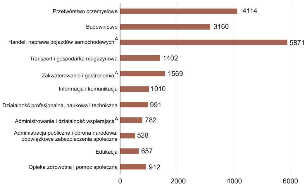
NOWO UTWORZONE MIEJSCA PRACY WEDŁUG WYBRANYCH SEKCJI W OKRESIE I-II KWARTAŁ 2016 R.