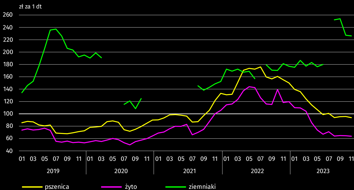
Wykres 6. Przeciętne ceny skupu zbóż i targowiskowe ceny ziemniaków jadalnych

Uwaga. W 2020 r. w miesiącach kwiecień-czerwiec i listopad-grudzień oraz w 2021 r. w okresie styczeń-czerwiec nie notowano transakcji sprzedaży/kupna na targowiskach. W lipcu 2021 r. wznowiono notowanie transakcji na targowiskach, jednak ceny żyta i ziemniaków jadalnych późnych, ze względu na ich brak w momencie prowadzenia obserwacji, nie zostały odnotowane.