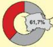
Międzynarodowy obrót morski International sea turnover