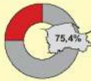
Obrót ładunków tranzytowych Transit cargo turnover