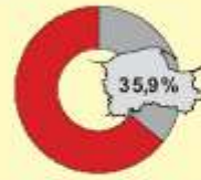
Statki wchodzące do portów Ship arrivals in seaports

a Łącznie z połowami kutrowymi na Atlantyku. a Including cutter fishing on the Atlantic.